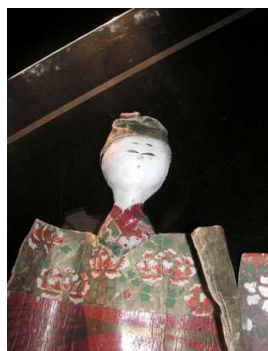
珍しい江戸の紙雛です。HPにも載せています。ご覧下さい