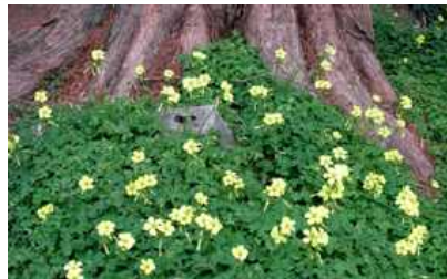
オキザリス (カタバミ)

もう園内にはタンポポ、オキザリス、キランソウ、スミレ、イヌノフグリが見られます。皆さんのお宅ではいかがですか？