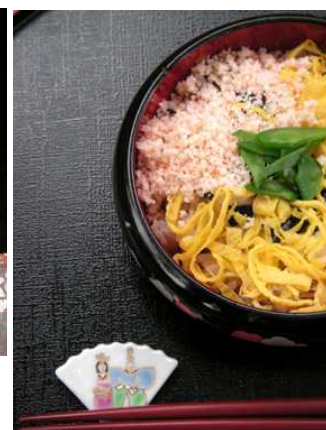
でんぶも自家製。エビのピンクがきれい

ニュースレターをみてきました、と言って下さった方にプレゼントを用意。スタッフへどうぞ。3月末まで。