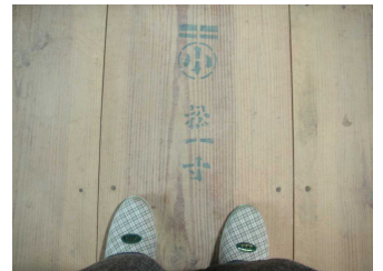
松一寸とあります