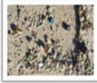
12/1 こどもの国(縦割り活動)

美しい下田の海にも環境問題は迫ってきています。濱崎小の子供たちは地域に強い愛着を持っています。その思いを郷土の誇りにしていくためにも迫りつつある問題から目をそらさない学びも必要だと考えます。三学期の始業式に子供たちに投げかけてみようと思っています。