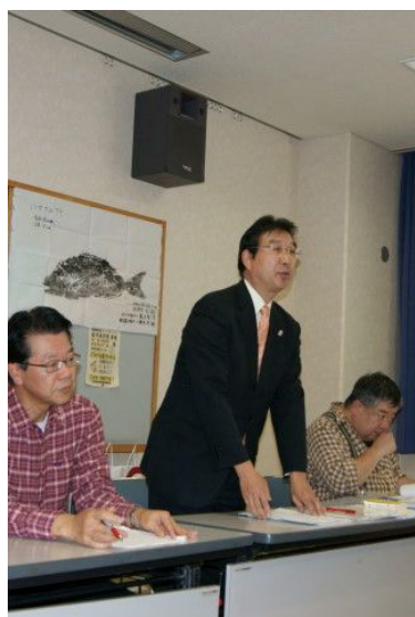
森協会長のご挨拶

その後、昨年度の釣果に関する各種表彰が行われ、無事閉会となりました。なお「平成23年度 東京協会年間日程」につきましては、前ページのシーガルFC年間活動計画に併記しております。