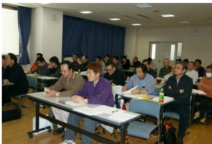
東京協会総会風景