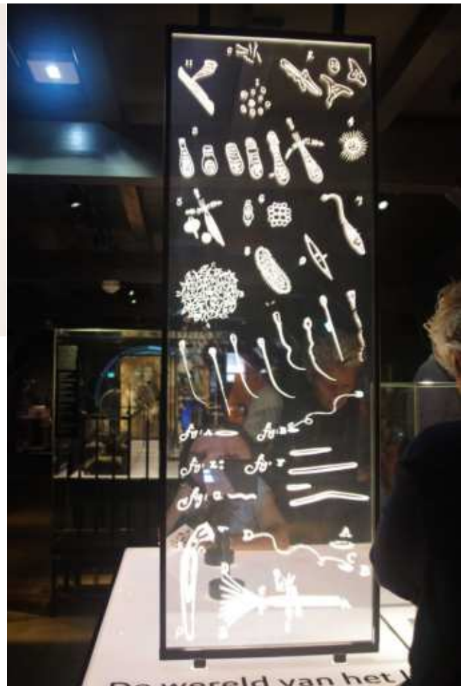
微生物のスケッチ（真ん中あたりに精子）