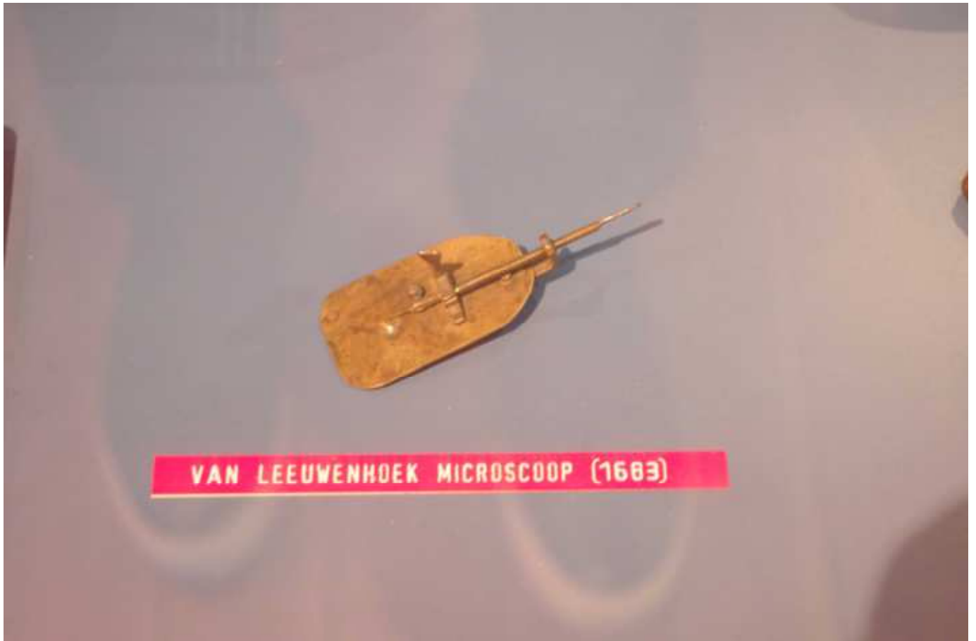
レーウエンフックの顕微鏡 (ユトレヒト大学博物館)