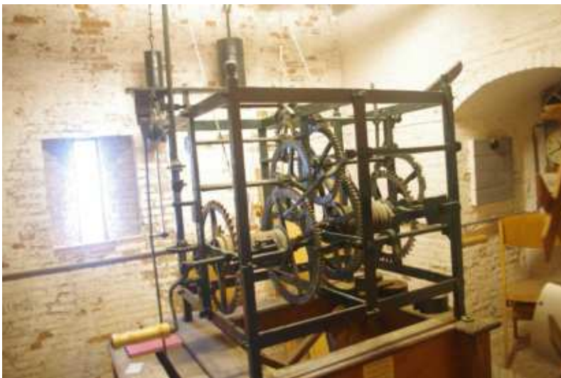
教会に設置された時計：ホイヘンスが初めて改良（実物） →それまでの時計に比べて精度が飛躍的に向上した