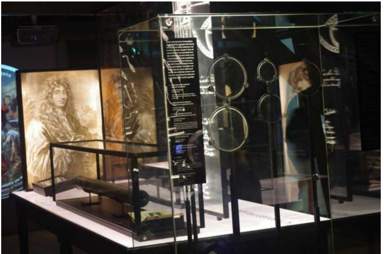
ホイヘンスの肖像画（左）と彼の望遠鏡及び磨いたレンズ類（手前の丸い円盤状のもの）