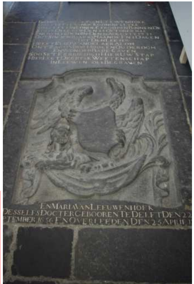
レーウェンフックの墓