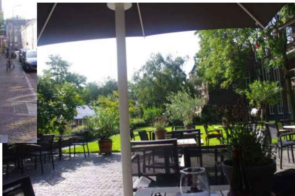
ユトレヒト大学博物館とそのカフェ