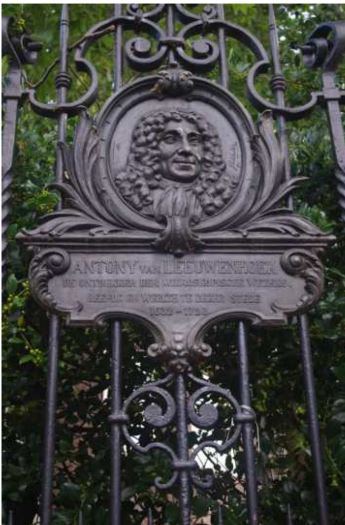
レーウェンフックの家の跡