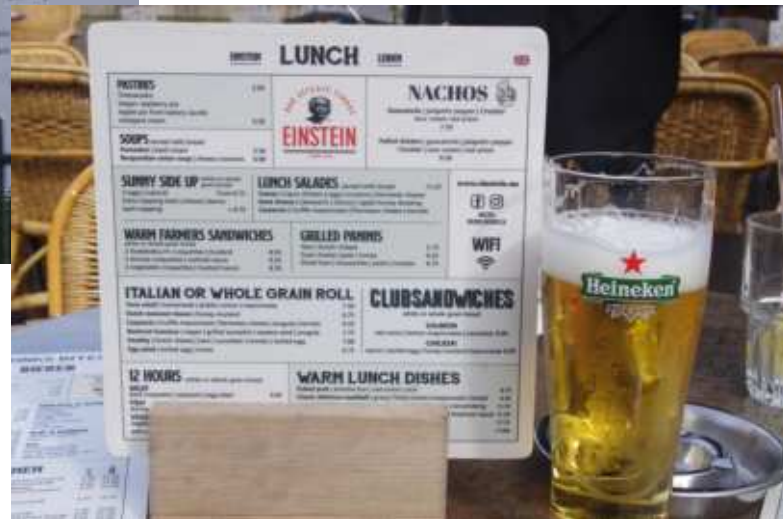
「アインシュタイン」という名のカフェ

因みに、ゼーマン効果（強い磁場をかけたときのスペクトル線の分裂）のゼーマンもライデン大学出身。