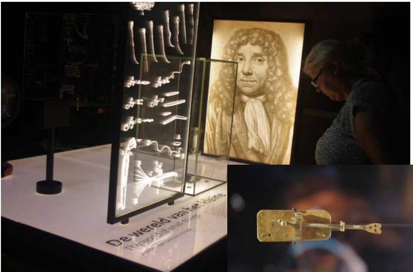
レーウエンフック展示の様子 (肖像画と彼が描いた微生物のスケッチ)