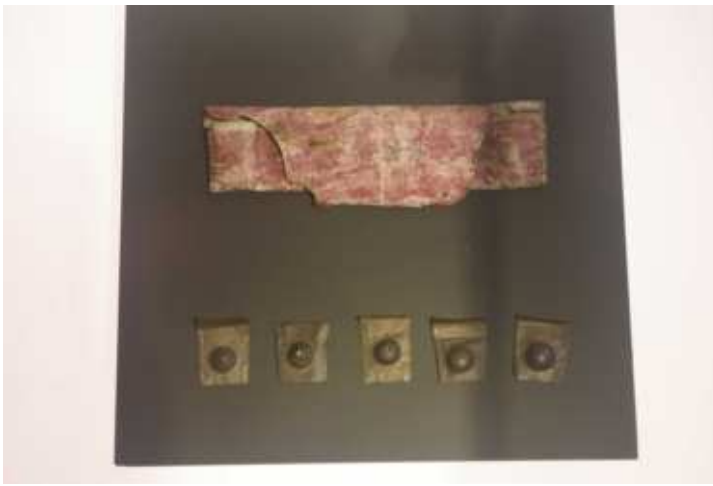
レーウェンフック自作の顕微鏡用単レンズ（下） とレンズケース（上）