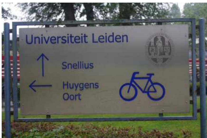
ライデン大学内の案内板 : スネルとホイヘンスの名が (建物名) (スネル、ホイヘンス共にライデン大学=オランダ最古の大学=出身)