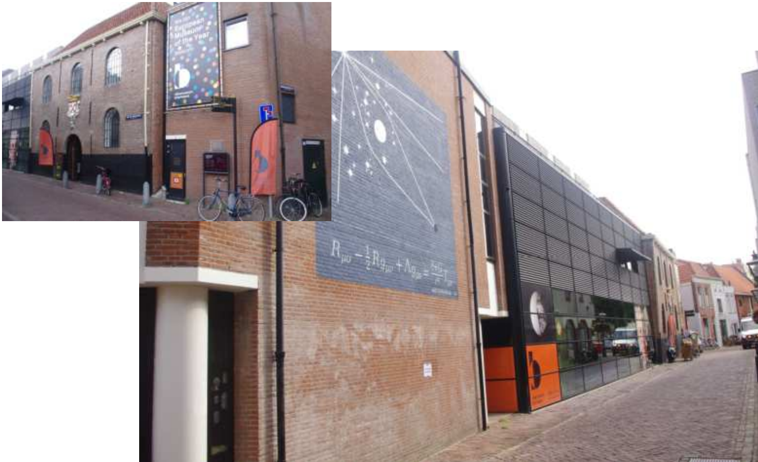
壁にアインシュタインの理論が描かれている →上記ホイヘンス、レーヴェンフックの資料が展示されている