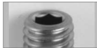
ホーローセット頭部

最近の遊具には上記ネジに半球型の面接着部を付加したボルトが使われています。 (人の面する側が球状に作られている)